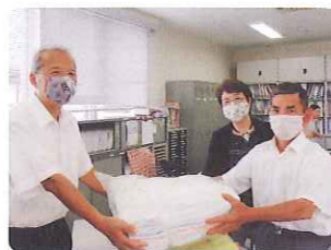
静岡県退職公務員連盟浜名支部