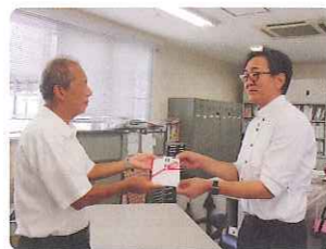
浜名湖電装労働組合