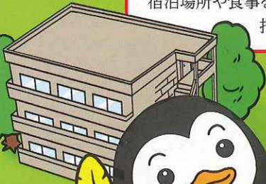
更生ペンギンの ホロちゃん

刑務所等を出た後、帰る場所がない人たちに宿泊場所や食事を提供し、自立に向けた生活指導を行う民間の施設です。