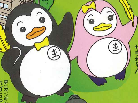
更生ペンギンの サラちゃん