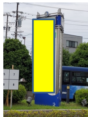
鷺津駅前 PR イメージ