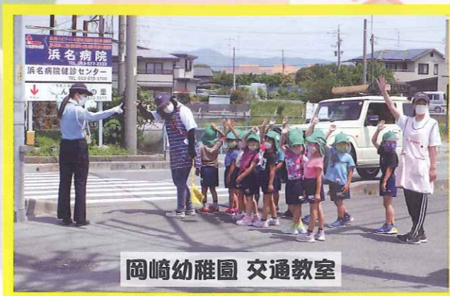
岡崎幼稚園 交通教室