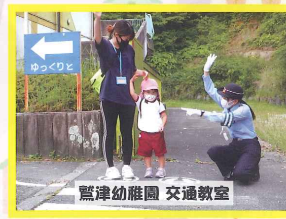
鷺津幼稚園 交通教室