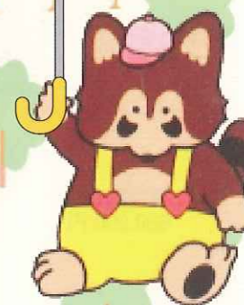
交通安全協会湖西地区支部 マスコットキャラクター まあこちゃん