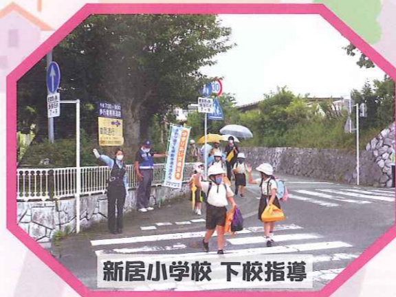
新居小学校 下校指導