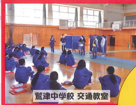
鷺津中学校 交通教室