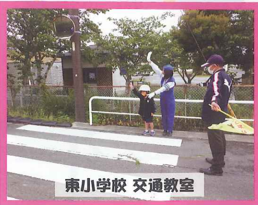
東小学校 交通教室