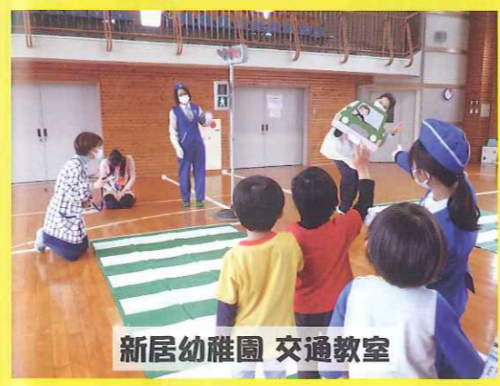
新居幼稚園 交通教室