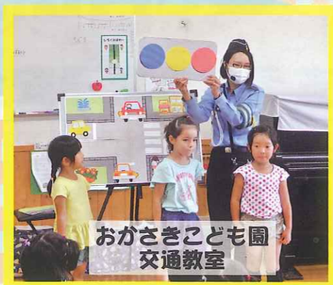
おかさきこども園 交通教室