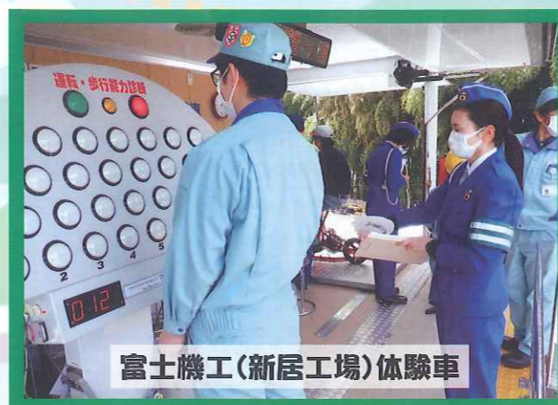
富士機工(新居工場)体験車