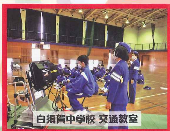
白須賀中学校 交通教室