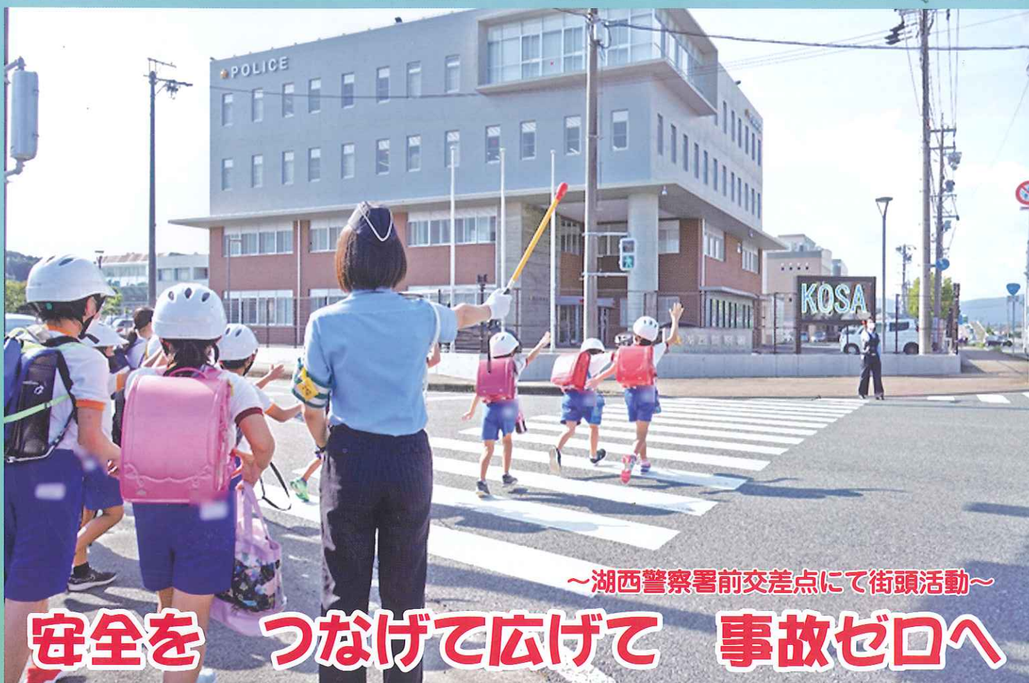
～湖西警察署前交差点にて街頭活動～

静岡県交通安全協会湖西地区支部 事務局／湖西市古見 1035 番地の 1 TEL：053-482-7355