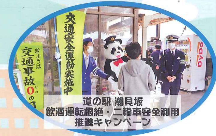
交通安全運動実施中 道の駅 湖見坂 飲酒運転根絶・二輪車安全利用 推進キャンペーン