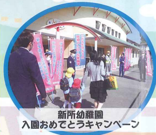
新所幼稚園 入園おめでとうキャンペーン