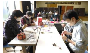
新所 & 入出