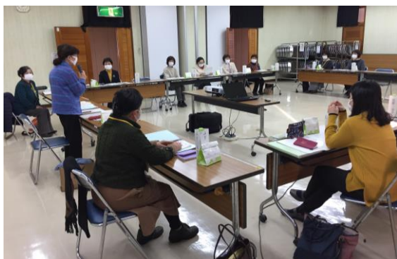
湖西市西部地域センター

11月、浜松駐在官事務所では少人数による県更女主催の研修があり、新会員3人が参加。12月、湖西地区で全新会員8人を対象に、会の理念や湖西地区の活動について、スライドを見ながら研修をしました。