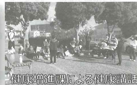
健康増進課による健康講話