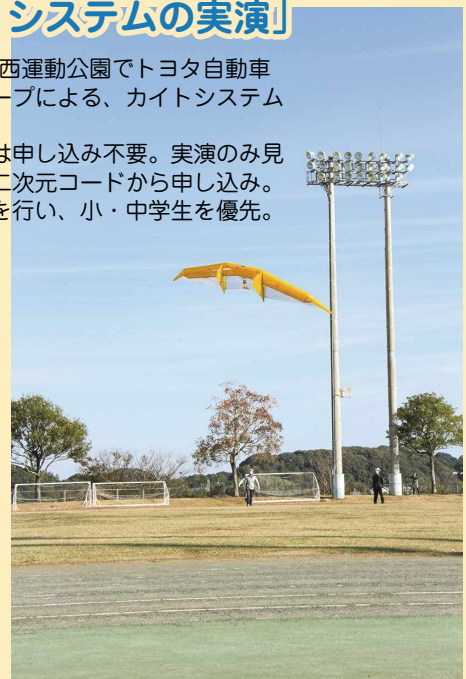
▲湖西運動公園でのテスト飛行

2020年5月: 高度1000m到達 2022年3月: 24時間連続飛行(予定)