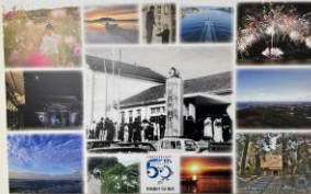
2022年度 湖西「コミュニティ」カレンダー