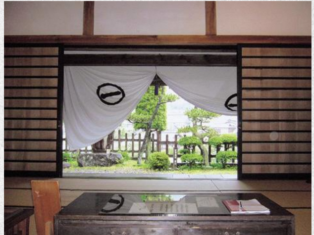
▲福島関所資料館 上番所