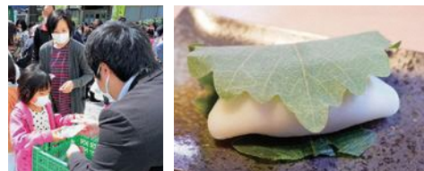
▲4月9日(土) 東伝馬公会堂にて