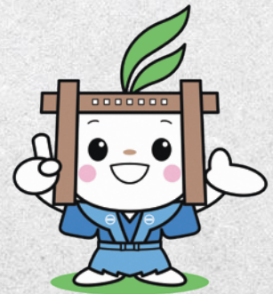
▲木曾町福島マスコットキャラクター「福ちゃん」

福島宿のほとんどを焼失してしまった昭和2年5月の大火を逃れた上の段地区は、古い家並みが今でも残っており、出梁造り・袖うだつ・千本格子などの建物や江戸時代からの水場が残っています。一年を通して、夜になると行燈に火が灯り、幻想的な町並みを見ることができます。