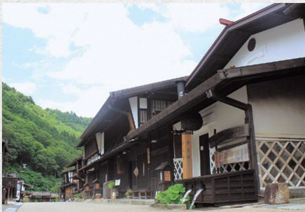
▲上の段地区（町並み）