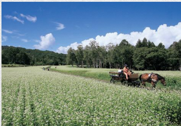
▲木曾馬の里 木曾馬とそば畑(9月)

居住地または通勤・通学先の住所が分かるものを持参のうえ、湖西市文化観光課(市役所2階)または、新居支所へお申し込みください。