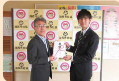
プライムアースEV エナジー株式会社