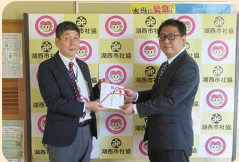
ヤマハ発動機労働組合