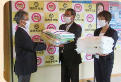
静岡県退職公務員連盟浜名支部