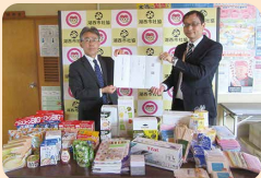
(株)ダイナム静岡新居店