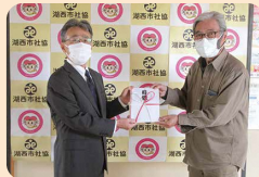
ふれんどサークル