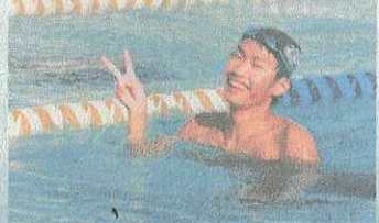
800mワレー 県大会出場