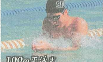
100m平泳 800mワレー 県大会出場