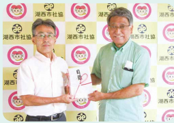
scale (湖西軽音楽愛好会)