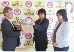
第一生命浜松支社湖西営業オフィス