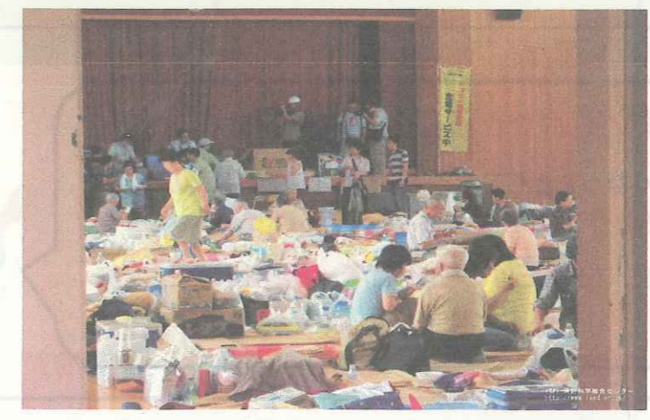
2007年新潟県中越沖地震 柏崎市避難所の様子

③ 土砂災害警戒区域外に住んでいて、大雨などにより自宅にすることが不安な人は、鷺津中学校区：鷺津中学校体育館 白須賀中学校区：白須賀中学校体育館 岡崎中学校区：西部地域センター 湖西中学校区：北部多目的センター 新居中学校区：新居地域センター へ避難してください。