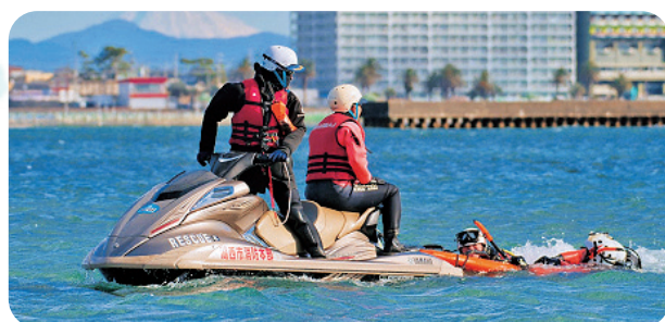
◀水上バイクを使用した水難救助訓練の様子