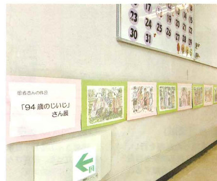
▲94歳のじいじさん展