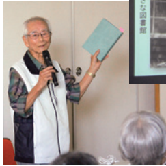
新居図書館 プレ100周年記念講演