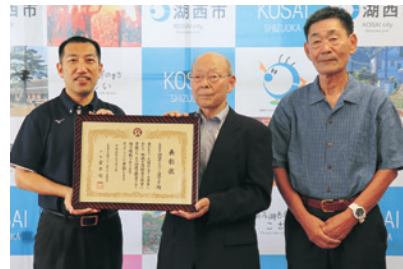
◀市長へ報告を行った湖西市シルバー人材センターの皆さん