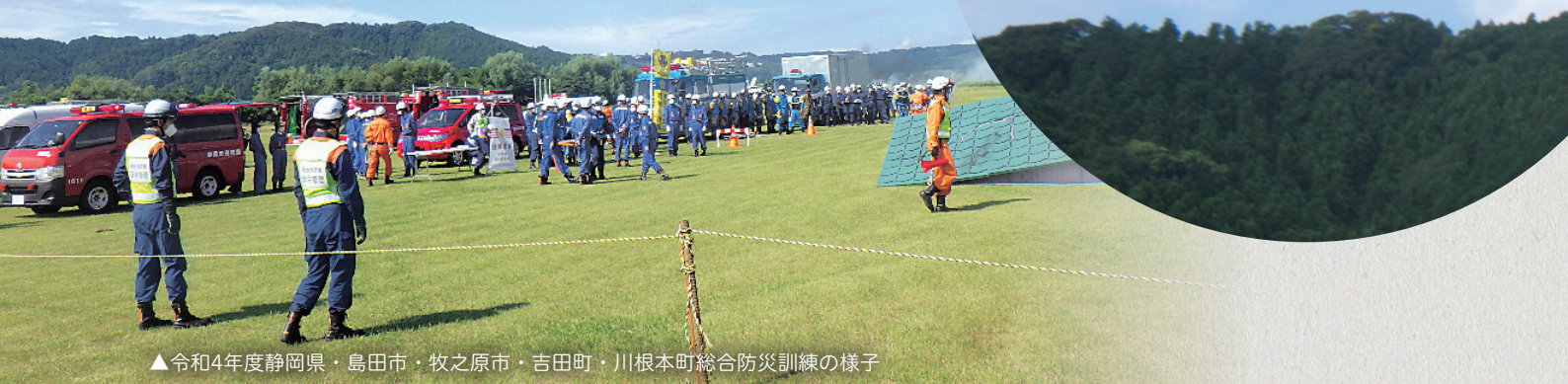
▲令和4年度静岡県・島田市・牧之原市・吉田町・川根本町総合防災訓練の様子

毎年9月に湖西市で行っている総合防災訓練。今年度は静岡県、浜松市と共催で9月3日(日)に実施します。今回の訓練では、地区ごとの実施に加えて、自衛隊や消防によるヘリコプター受け入れ訓練、自主防災会など地元住民と実施する避難所開設訓練など、市内15カ所で開催する予定です。