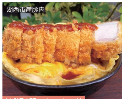
湖西市産豚肉 [低温]閉じないカツ丼