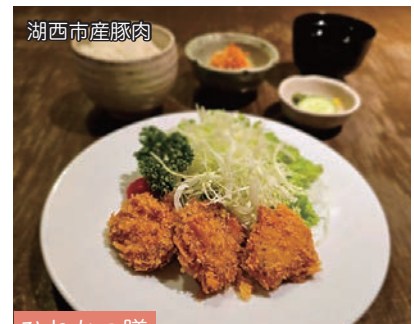
湖西市産豚肉 ひれかつ膳