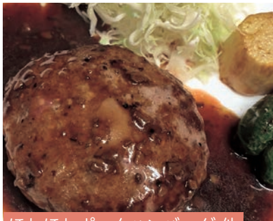
ほわほわポークハンバーグ 他