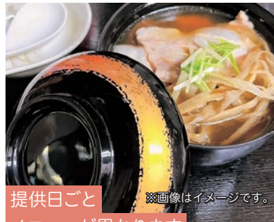
提供日ごと メニューが異なります ※画像はイメージです。