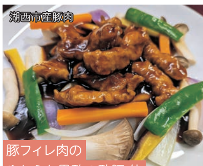
豚フィレ肉の やわらか黒酢の酢豚 他