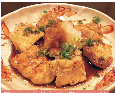
豚ロース塩焼きポン酢おろし 他