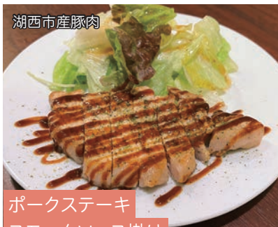
湖西市産豚肉 ポークステーキ スモークソース掛け