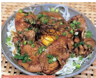
豚のたまり焼き 他