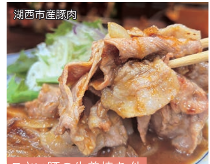
湖西市産豚肉 こさい豚の生姜焼き 他