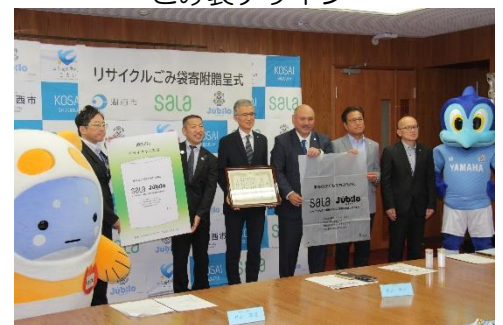
昨年度贈呈式の様子