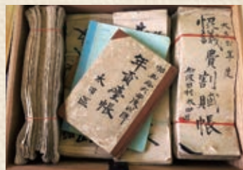
▲公民館で保管されていた古文書

古文書とは古くなった書類のことです。残された古文書の多くは江戸時代のもので、それが書かれた当時のことを知る大切な文化財です。江戸時代の基礎的な行政単位は「村」で、湖西市域には24の「村」がありました。現在の住居表示での大字が、大体は江戸時代の「村」に当たると考えてよいでしょう。市域にはある程度の古文書が確認されていますが、未確認のものも残っていると推測されます。江戸時代には、領主役所から文書で村ごとに納入すべき年貢を始めとする諸事項が通達され、村からは領主に対し文書で願書などを上申しました。これらは公文書であり、証拠書類として「村」で保存していました。これらの公文書のほかにも、多くの私文書や農業技術所・手習い本・読本なども出回っており、これらを総称して古文書と言います。