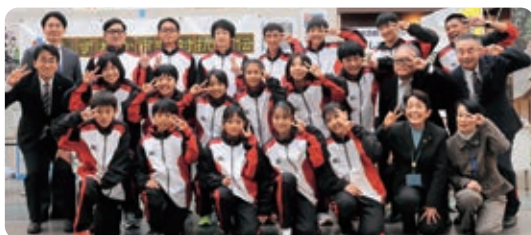
▲第26回しずおか市町対抗駅伝競走大会出発式の様子