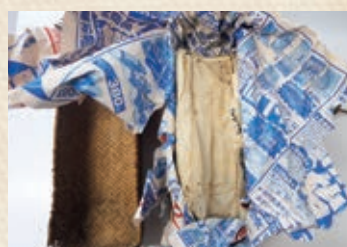
▲行李からでてきた古文書