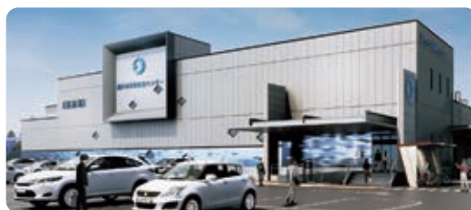
◀令和9年に完成予定の学校給食センター(イメージ図)

●浜松湖西豊橋道路の湖西市ルートについて説明会を開催。など、さまざまな意見がありました。皆さま投票ありがとうございました。