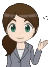
▲チャットボット “税務職員ふたば”