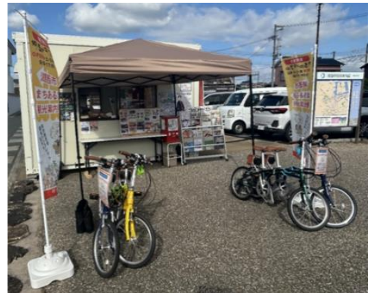
令和7年度のまちあるき観光案内所 （新居地域）