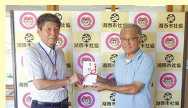
scale(湖西軽音楽愛好会)