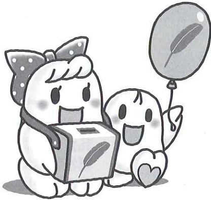
あいやん と 希望くん

赤い羽根共同募金は、支援を必要とする方々への支援や誰もが安心して暮らせる地域づくりの事業などのために、10月から一般募金、12月から地域歳末たすけあい募金が行われます。