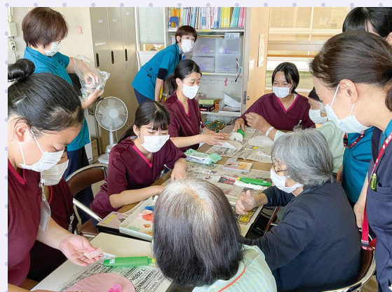
▲ 院内デイケアでの作品づくり・入院患者さんとの交流