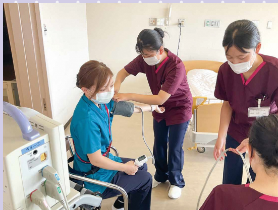
▲ バイタルサイン測定