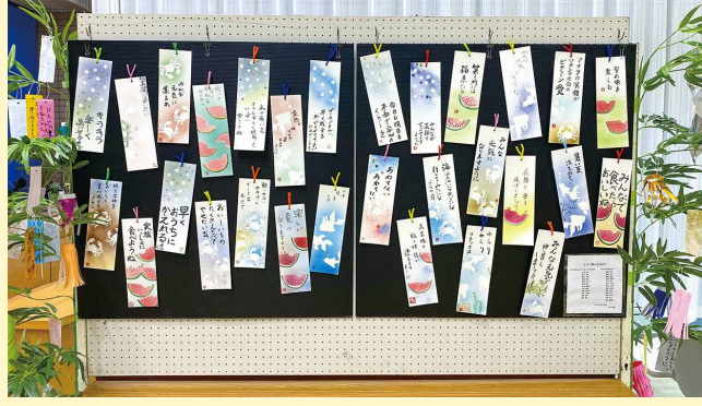
△院内ロビーの様子

6月26日(月) から7月7日(金) まで「院内七夕週間」として、病院を訪れる人たちや入院されている患者さんたちに、季節感を味わっていただくため、院内ロビーに笹へ短冊を飾り付けができるスペースを設けました。