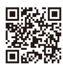
▲電子申請による申込み