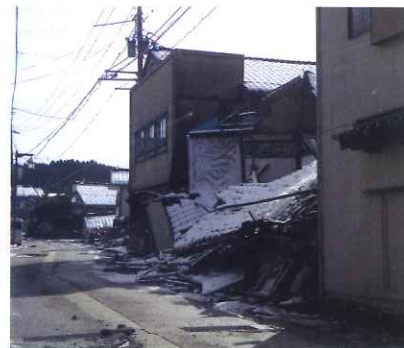
能登半島地震の被害状況