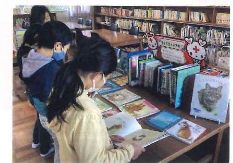
青少年赤十字文庫を楽しむ児童