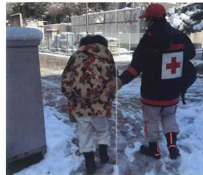
被災者に寄り添う浜松赤十字病院職員