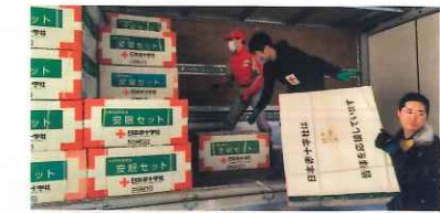
志賀町に救援品を届ける支部職員

被災された方に迅速な支援ができるよう、災害救援品を備蓄しています。 能登半島地震では、石川県支部の要請を受け、1月4日に志賀町へ毛布750枚、安眠セット225セットを届けました。