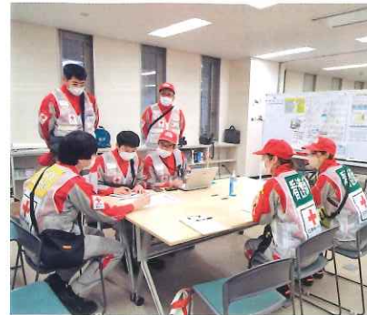
現地で打ち合わせする静岡赤十字病院救護班

発災時に迅速かつ的確に任務を遂行できるよう、県内の赤十字病院（静岡・浜松・伊豆・引佐・裾野）に救護班を編成し、日頃から訓練や研修を行っています。 令和6年1月1日に発生した能登半島地震では、被災地に救護班4班、災害医療コーディネーターチーム1班を派遣しました。（1月末時点）