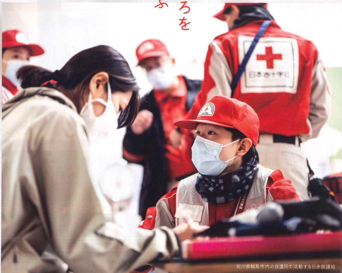
石川県輪島市内の救護所で活動する日赤救護班