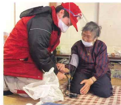
避難所での診療の様子