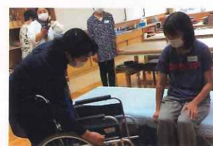
健康生活支援講習

令和6年度は、これらの講習を約600回、22,000人の方に受講いただく予定としております。「いざ!」というときのための知識や技術を広めていきます!