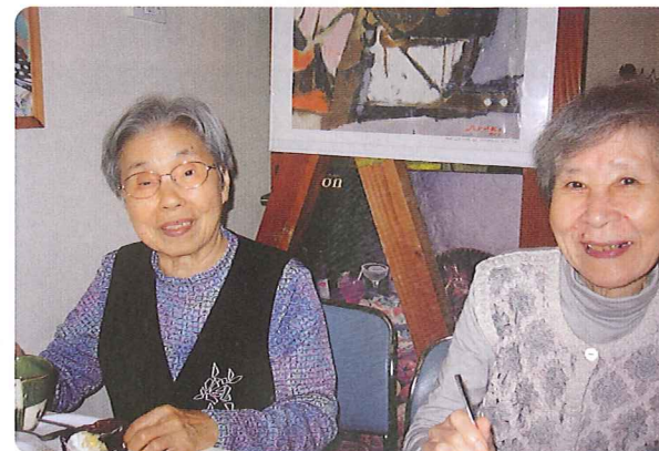
機能訓練を兼ねて、時には喫茶店等への外出も

デイサービスでは入浴や食事・趣味活動・機能訓練などを行うことで、ご利用者の皆さんが、その人らしく生き生きと過ごすことができるように。また、ご家族の介護負担が軽減できるように支援させていただいています!