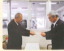
ふれんどサークル義援金