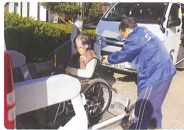
車いすでも送迎は安心・安全です

デイサービスでは入浴や食事・趣味活動・機能訓練などを行うことで、ご利用者の皆さんが、その人らしく生き生きと過ごすことができるように。また、ご家族の介護負担が軽減できるように支援させていただいています!