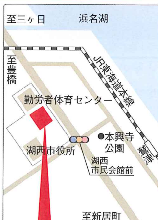
湖西市健康福祉センター おぼと