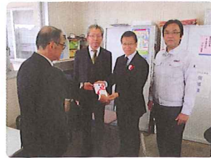
静岡県トラック協会西部支部西部分室