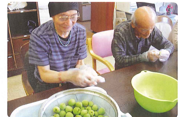
みんなで梅ジュースづくり