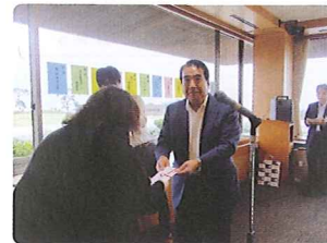
浜名湖カントリークラブ