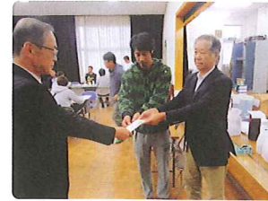
入出ゴルフ愛好会