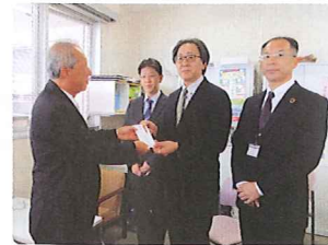
湖西地区労働者福祉協議会