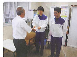
スズキ(株)湖西工場組長会