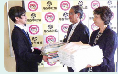
静岡県退職公務員連盟浜名支部