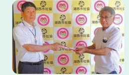
scale (湖西軽音楽愛好会)