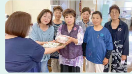
カラオケ・喫茶ひばり