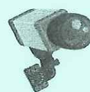
防犯カメラ センサーライト