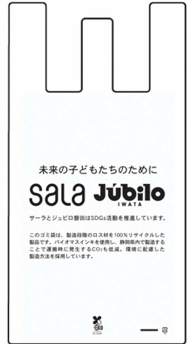
ごみ袋のデザイン