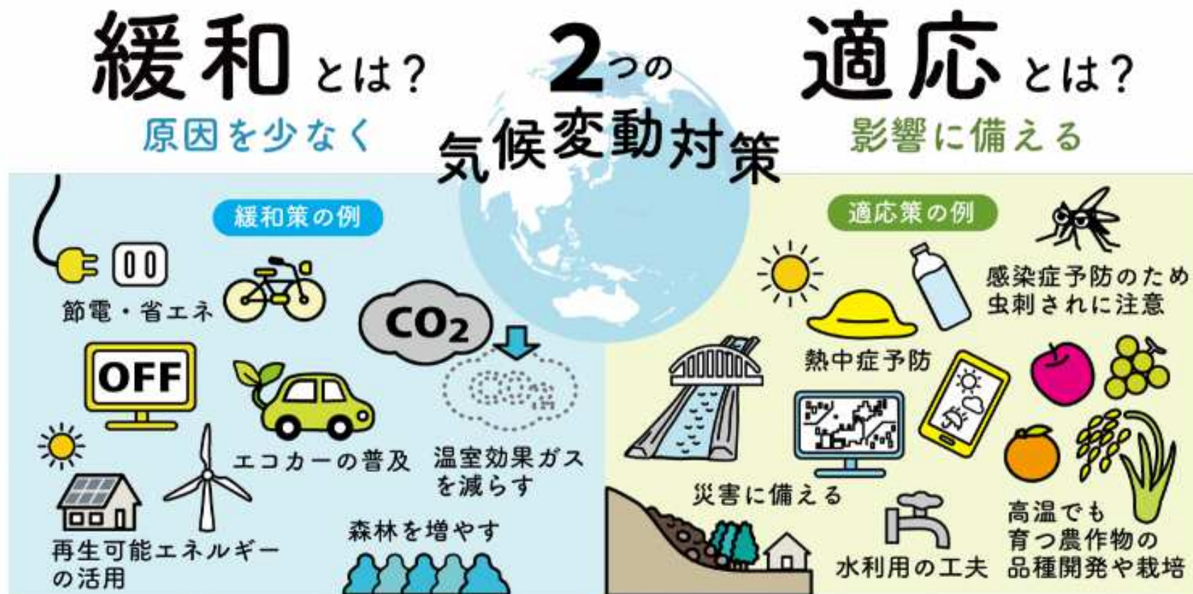
図.緩和策と適応策

気候変動問題への対策として、地球温暖化を緩和するための 緩和策 （本計画にて策定）と気候変動の影響に備えるための 適応策 があり、日本でも緩和と適応の両輪で気候変動の課題に社会全体で取り組むことが求められています。