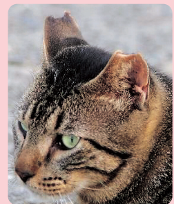
▲不妊去勢手術を受けた地域ねこは、両耳をさくらの花びらのようにカットされています