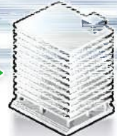
経済産業省 産業保安監督部長

http://www.meti.go.jp/policy/safety_security/industrial_safety/links/kantokubu.html