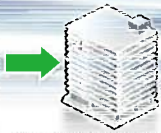
経済産業省産業保安監督部長