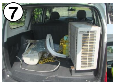
家電リサイクル券と家電を 引き取り業者に運ぶ

窓口で支払い関係の書類を渡し、押印された振替 払込受付証明書をもらい、家電リサイクル券に貼る