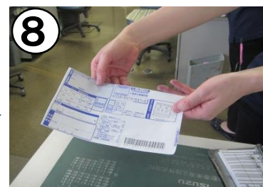
家電リサイクル券の写しを貰う