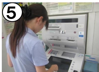
ATMか窓口で料金を支払う