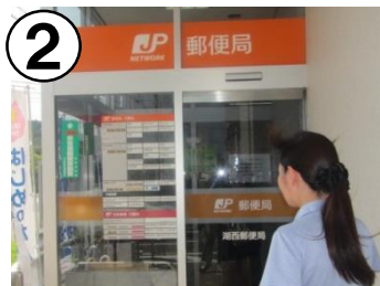
お近くの郵便局へ