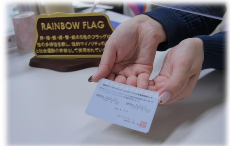
受領カード（免許証サイズ）