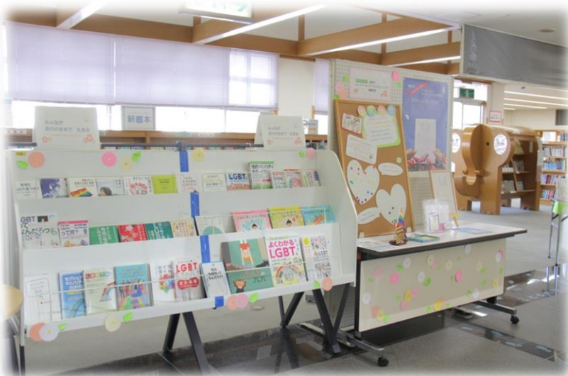
▲湖西市中央図書館(令和4年2月)

広報啓発及び学習機会の提供により、多様な性に対する理解を促進し、 性的マイノリティ当事者の生きづらさや困難を解消する。