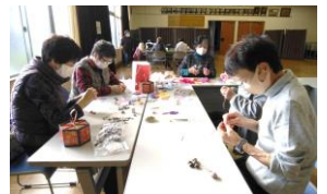
新所 & 入出