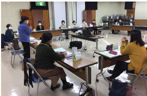
湖西市西部地域センター

11月、浜松駐在官事務所で少人数による県更女主催の研修があり、新会員3人が参加。12月、湖西地区で全新会員8人を対象に、会の理念や湖西地区の活動について、スライドを見ながら研修をしました。