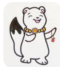
更生保護女性会員の オコジョさん

子どもたちの健やかな成長を願い、地区ごとに「愛の鈴」を作っています。しじみの貝殻を着物の布地でくるみ、ラメ糸で縁どりをし、紐と鈴をつけて完成。みんなで楽しくおしゃべりしながら活動しています。