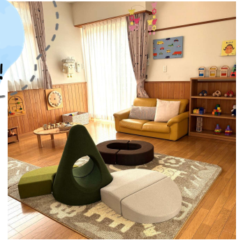
「ハイハイの丘」が新しく入りました

こんにちは！微笑こども園となりの「ほほえみ」です。 子育て中のママ・パパはもちろん、おじいちゃんおばあちゃん 妊婦さんなど、子育てに携わるどなたでもご利用いただける 支援センターです。