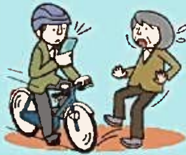
スマホ等使用運転