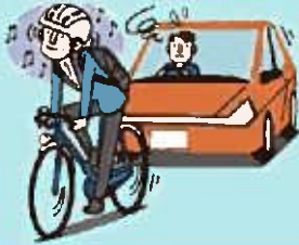
イヤホン等使用運転