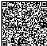
Forma de registrarse

▼ Informaciones: Departamento de gestión de crisis (Kiki Kanri-ka) ☎ 053-576-4538 FAX 053-576-2315