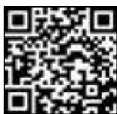
Sitio para registrarse

Es recomendable hacer el registro antes que ocurra un desastre. Puede escoger entre los idiomas de japones, portugués, español y japones sencillo.