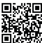
Rede Social Instagram