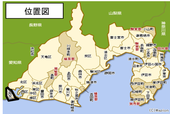
※令和6年1月1日より浜松市の行政区が変更しています。