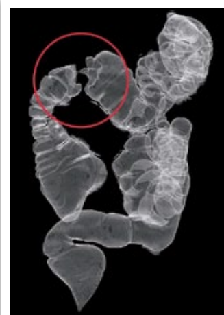
大腸CT検査における 大腸全体の写真 (○印が大腸がん)