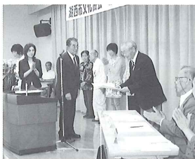
▲感謝状贈呈式の様子