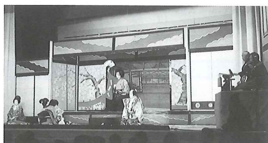
ごしよざくらほりかわようち べんけいじょうし ば ③御所桜 堀川夜討=弁慶上使の場