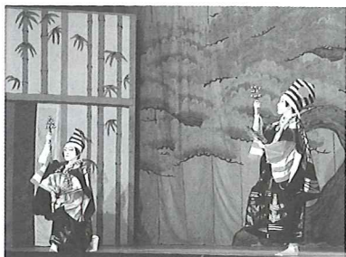
ことぶきききさんぼう ①寿式三番叟