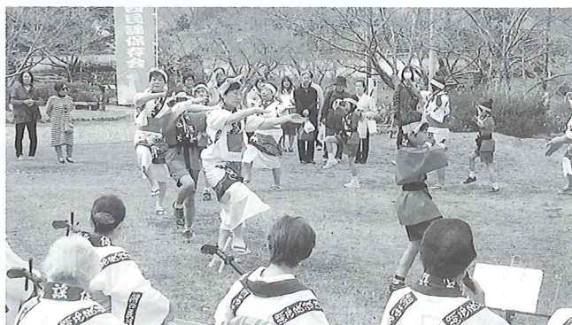
▲おどりの発表 (本興寺境内の公園) 4月2日(日) 湖西民謡保存会 (鷺津節、ちゃっぎり節) など披露した。