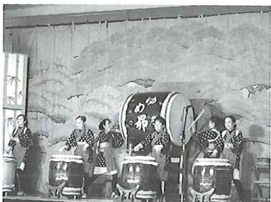
①平成ちゃつきり節