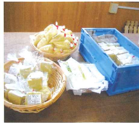
きび・きびもちの販売