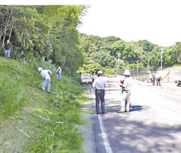
静岡県シルバー人材センター(安全就業パトロール)