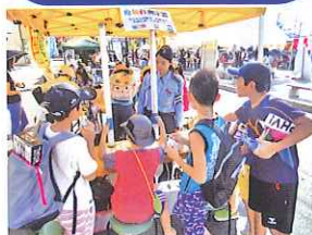
俊敏性測定器の体験