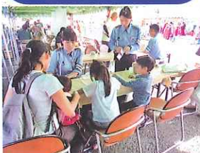
オリジナル反射材作り