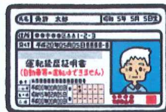
「運転経歴証明書」見本