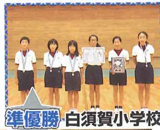
準優勝 白須賀小学校