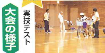
大会の様子 実技テスト