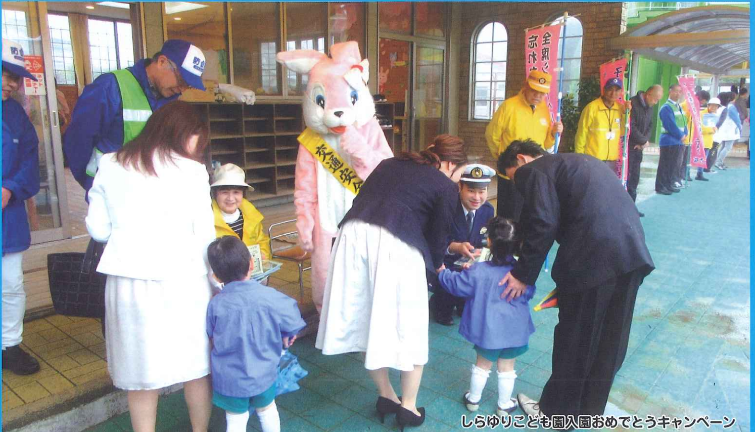
しらゆりこども園入園おめでとうキャンペーン

静岡県交通安全協会湖西地区支部 事務局／湖西市新居町新居 3380-268 TEL：053-594-0571