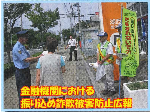
金融機関における 振り込み詐欺被害防止広報