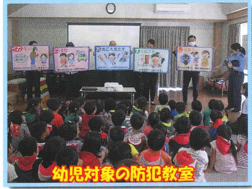
幼児対象の防犯教室