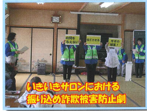
いきいきサロンにおける 振り込み詐欺被害防止劇