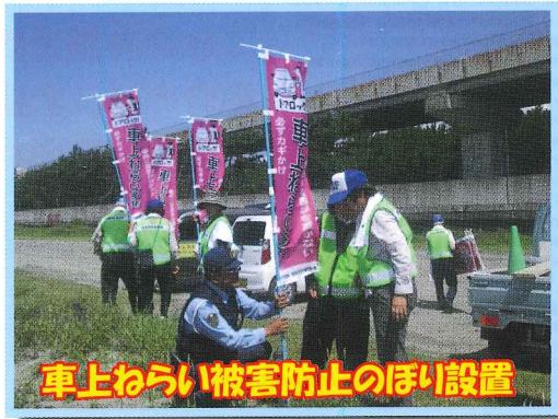
車上ねらい被害防止のぼり設置