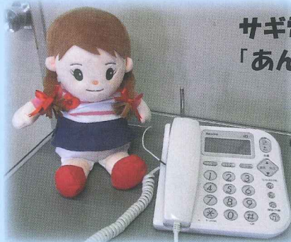
サギ電話注意喚起人形 「あんしんみーちゃん」