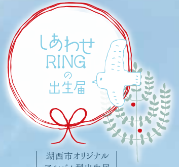
湖西市オリジナル アルバム型出生届