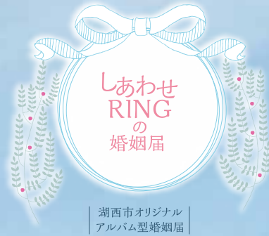
湖西市オリジナル アルバム型婚姻届

大切な人とのつながり、家族とのつながり。 RING(リング)は永遠のつながりを表す形。 「これからも大切な家族とずっと…」 そんな想いをこめた届書です。 ここから始まる新しい人生を、 湖西市もささやかながらお祝します。