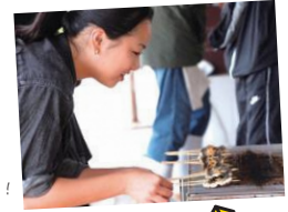
つかみ取りしたうなぎは、 かば焼きにして食べられるよ！