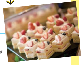
キャトルセゾン特製 スイーツ&ドリンク付き