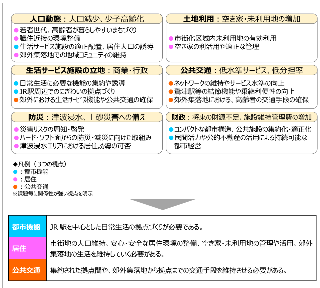
図. 3つの視点別の課題の整理

各分野別の課題を踏まえ、「都市機能」、「居住」、「公共交通」の3つの視点で、本市の課題を整理しました。