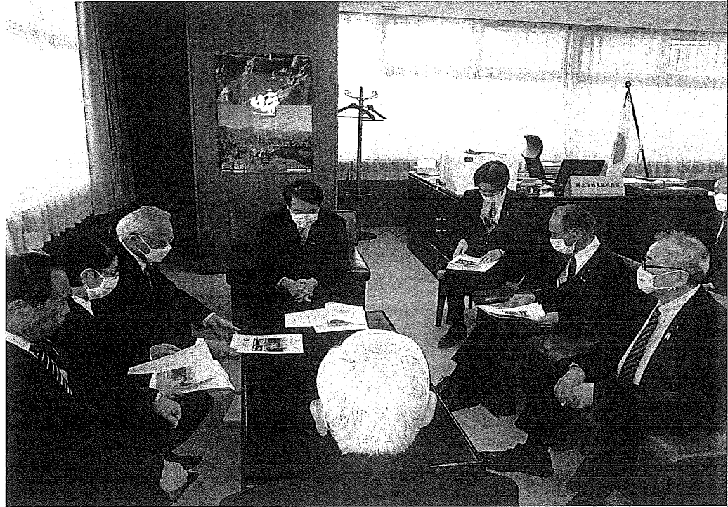
(要望事項1～4 泉田裕彦国土交通大臣政務官に面談)