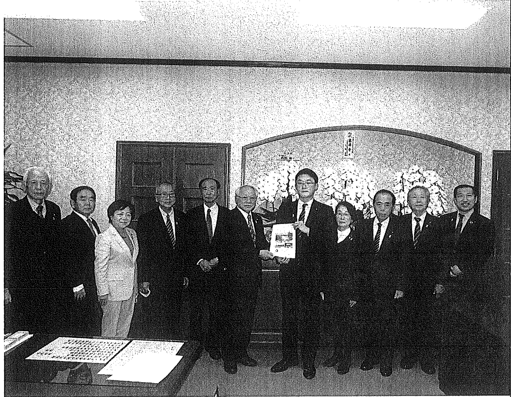
(要望事項 1～5 藤原崇財務大臣政務官に面談)