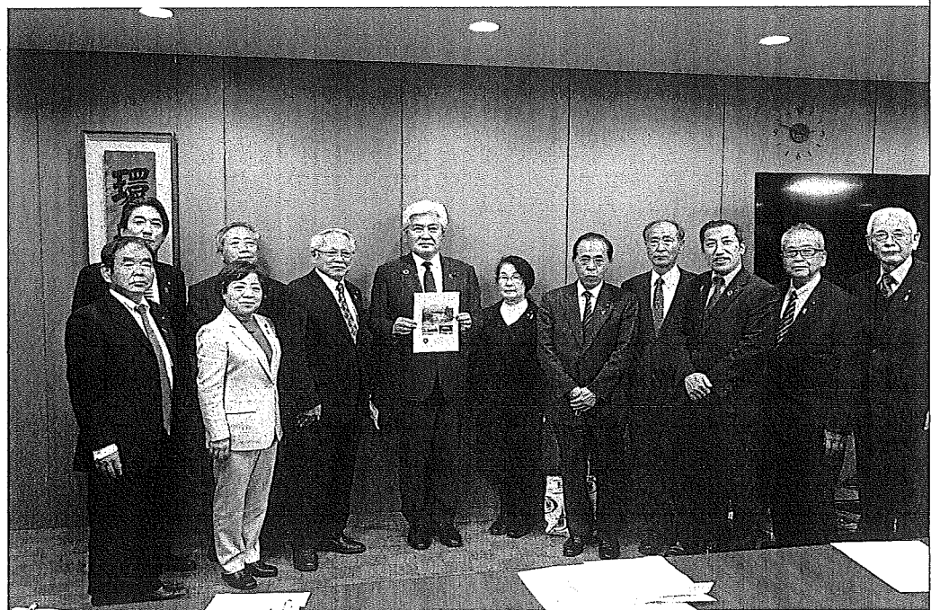
(要望事項5 務台俊介環境副大臣に面談)