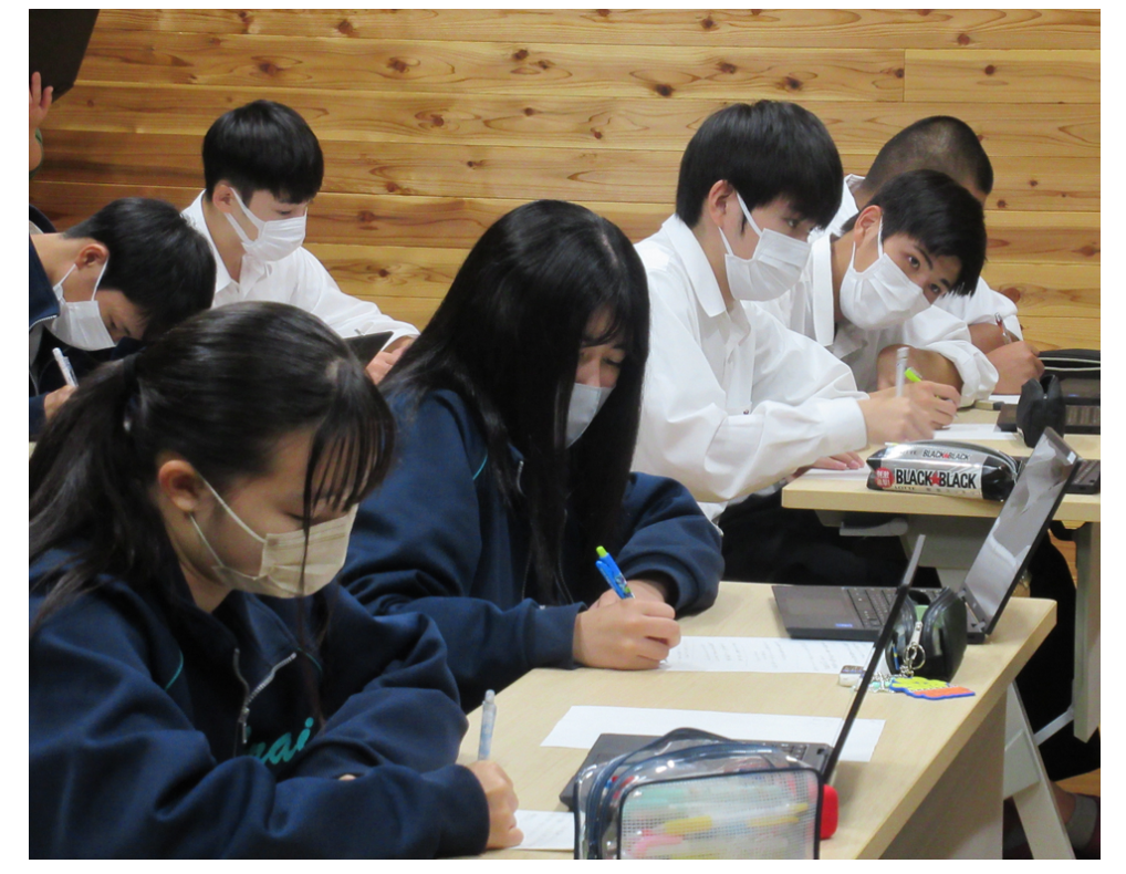
9月9日 文化観光課 新居弁天再開発